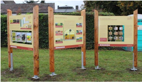
Mitmachstationen „Nachwachsende Rohstoffe im Römerpark

1. Leitkonzept „Nachwachsende Rohstoffe für alle Schularten“ in Umsetzung