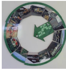
Seminarraum Kompostieranlage ZAW

Projekttag Bioenergie für alle Schularten, Zukunft jetzt e. V.